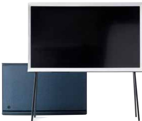
1 / 布鲁克兄弟为 SAMSUNG 设计的平板电视犹如复古画框，上部平台可放置小件饰物。