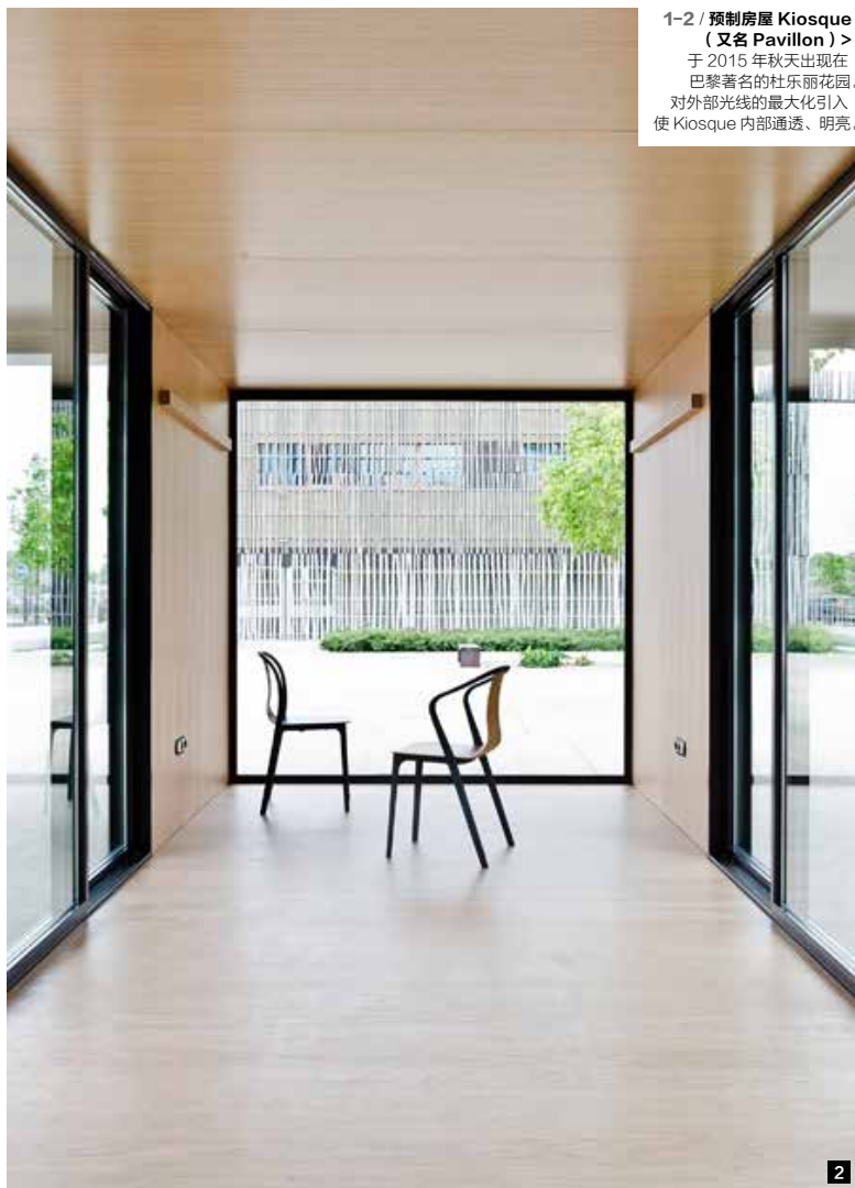
1-2 / 预制房屋 Kiosque (又名 Pavillon) > 于 2015 年秋天出现在 巴黎著名的杜乐丽花园。 对外部光线的最大化引入 使 Kiosque 内部通透、明亮。

尽管布鲁克兄弟不断尝试工业模块化的更多可能，但同时他们常汲取自然界中的有机形态或以精巧的手工艺为灵感。比如为 Vitra 设计的藻类形态的浴室隔断、Vegetal 椅子，以及为 Iittala 设计的组合花瓶 Ruutu。布鲁克工作室每年有大约 30 个设计项目同时进行，每个项目的持续时间平均为 2 年左右，商业设计与试验性作品同时进行，处于不同阶段的工作相互交织，时而相互影响和启发。“无论是与品牌合作的商业项目还是我们的设计研究工作，我们都不会对其进行区分和设定限制，如此才能将我们的全部想法展示出来。”对此，两人解释道。