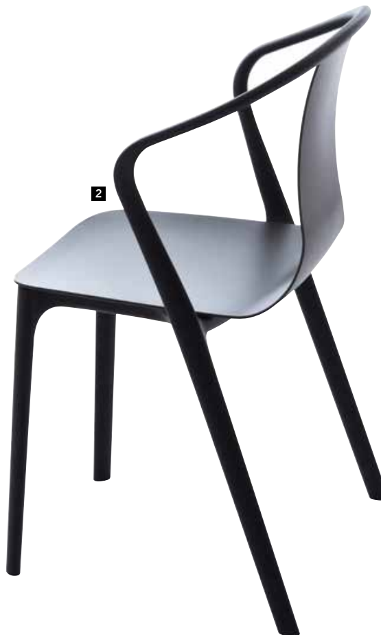
2 / Belleville Chiar > 2015 年作品，Vitra 出品。