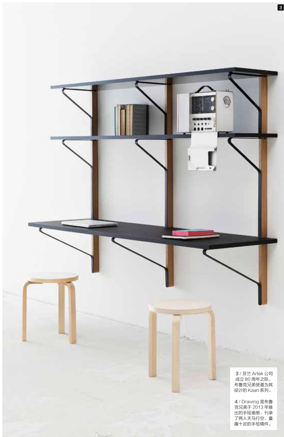
3 / 芬兰 Artek 公司成立 80 周年之际，布鲁克兄弟受邀为其设计的 Kaari 系列。